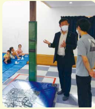
▲富山市内の放課後児童クラブ施設にて

放課後児童クラブの受け皿整備・放課後子ども教室との連携推進に12億円を計上!(令和4年度第二次補正予算)