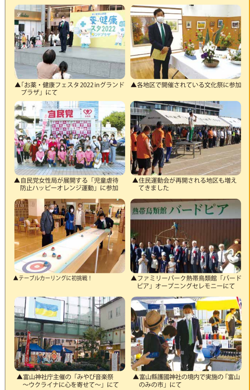
▲「お薬・健康フェスタ2022 in グランドプラザ」にて ▲各地区で開催されている文化祭に参加 ▲自民党女性局が展開する「児童虐待防止ハッピーオレンジ運動」に参加 ▲住民運動会が再開される地区も増えてきました ▲テーブルカーリングに初挑戦! ▲ファミリーパーク熱帯鳥類館「バードピア」オープニングセレモニーにて ▲富山神社主催の「みやび音楽祭 ~ウクライナに心を寄せて~」にて ▲富山縣護國神社の境内で実施の「富山のみ」にて